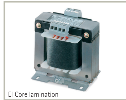
EI Core lamination

W fe = no-load losses W tot = full-load losses